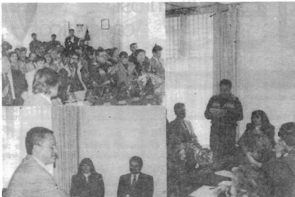
Algunas imágenes del evento